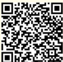
Google Drive อัปโหลดเอกสาร PA ปี 2568